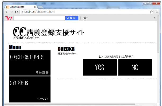
図 2.7 適性資格チェッカー

二択の質問に答え、資格の適性チェックを行っていく。質問に答えていくと最終的に産業情報学科での講義で取得する事のできる八つの資格の中から、回答者に向いていると思われる資格のページに飛ぶ。