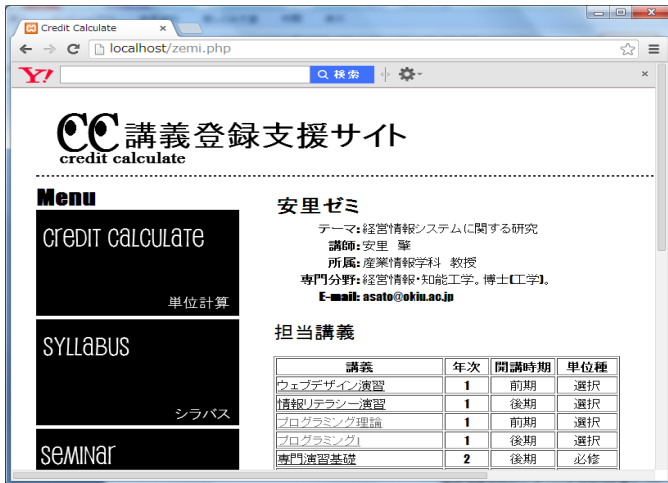
図 2.5 ゼミ情報

さらに、ゼミで主にやっている事や過去の卒業論文テーマ、先輩たちの就職先なども見る事ができ、ゼミに入った後でも学生たちをサポートしていけるように工夫している。