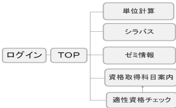
図 2.1 システム構成図