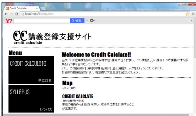
図 3.2 トップ画面

トップページには、本サイトの概要と各項目の簡単な案内を載せている。項目は単位計算、シラバス、ゼミ情報、資格取得科目案内、適正資格チェッカーに分かれているので、自分の目的に合わせて左のナビより各ページに移動する。