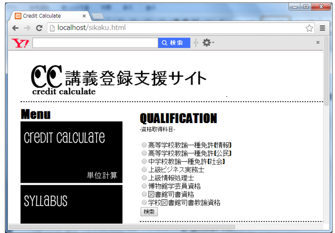
図 2.6 資格取得単位一覧

そこでこのページでは、沖縄国際大学で所定の科目を履修することによって取得できる資格のリストをチェックする事ができるようにした。その資格の内容、生かせる職業等、取得に必要な講義の情報が載ったページに移動する。そこから資格取得単位一覧のページに移動することもできる。また、資格取得のための科目には履修料を支払うものも多いので、各資格取得科目にかかる合計金額も記載する。