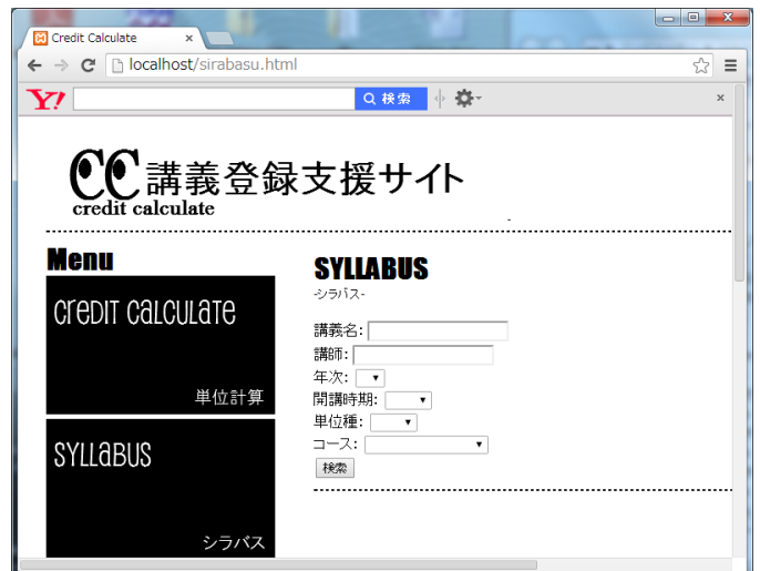
図 2.4 シラバス

検索されたデータは表で表示され、講義名・講師名・開講年次・開講時期・単位種・単位数を一目でチェックする事ができる。また講義名をクリックすると授業概要や評価方法など、講義の詳しい情報が載ったPDFが表示される。