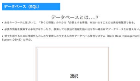
図 2.3 eラーニングコンテンツ

eラーニングでは、基礎・基本を学べるようになっている。過去問を解いていく中で、自分自身だけでは解けない問題がでてくることがある。その際、理解している人に聞いて自分自身の理解を深める必要がある。しかし、毎日教えてくれる人が隣にいるわけではない。専門の先生や理解している人がいなくてもeラーニングを使ってわからないことを自分自身で理解を深めながらゆっくり学習できる環境になっている。