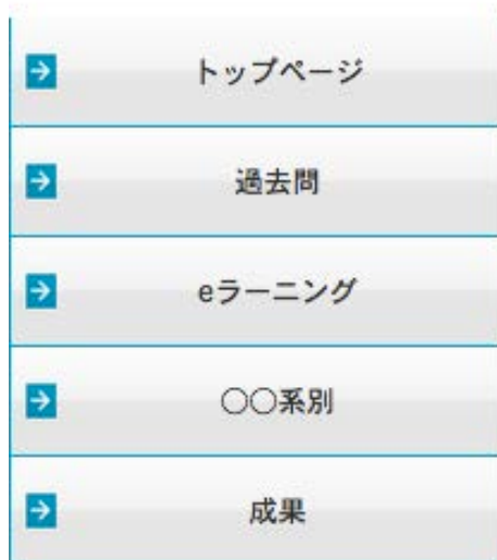
図 2.1 選択画面

コンテンツ制作グループでは、HTML・PHP・Mysqlを用いて、ウェブコンテンツを制作する。