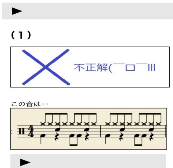
図 2.4 クイズ画面

ここでは、実際に音と譜面を用いたクイズがある。最初に、音源を流し、それを聞き取る。それに対して、どの譜面がその音に当てはまるかをクイズ形式で答えていく。正解した場合は、次の問題にランダムで移るリンクが出現する。また、不正解の場合には、その譜面の実際の音が聞けて、正解するまで次の問題に移れない仕組みになっている。