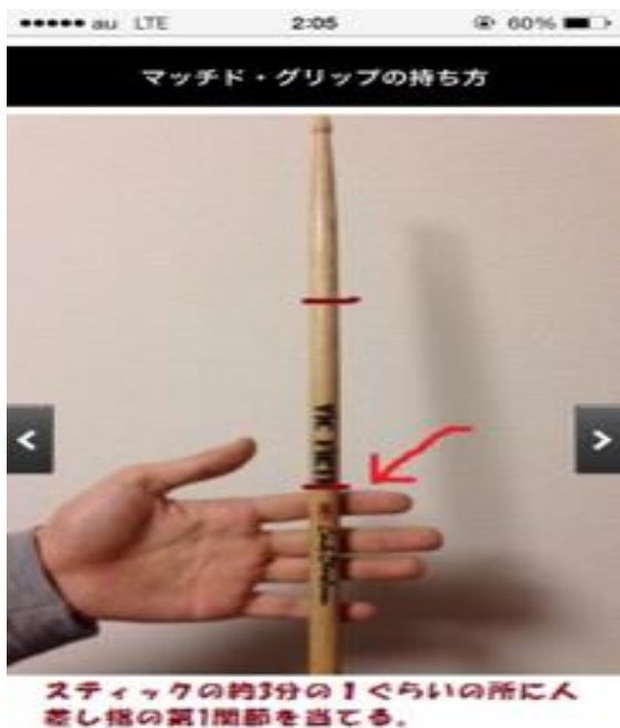
図 2.3 ドラムの基本