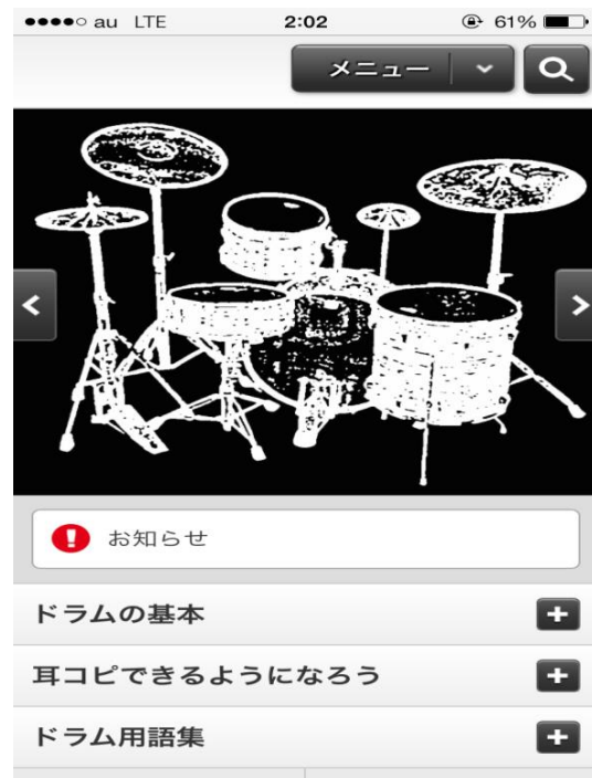
図 2.2 トップ画面

全体の画面を見やすくする為、見開きの目次は少なくしている。アコーディオン機能でシンプルに目次を見ることができる。また、「ドラム」関連のサイトという事がひと目でわかるようにトップにイラストを載せ、一定時間経過すると画面がスライドするようになっている。また、ヘッダーのメニューの部分の矢印を押すとページ下方の項目がそれぞれ表示されるようになっている。検索ボタンは配置しているが、まだサイト検索はできないようになっているので、今後検索できるようにする予定である。