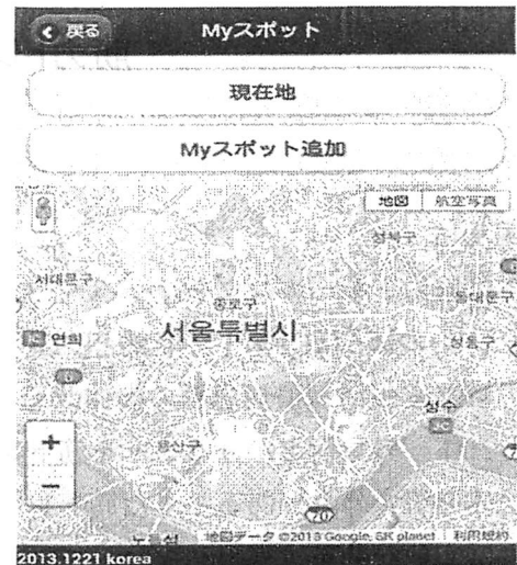
図 3 My スポット

旅行の目的として、「観光」が多いため韓国で有名なソウルタワーや韓国民族村、また k-pop の事務所など、人気のあるオススメスポットを紹介する。またオススメスポット機能の中にある My スポット機能では、行きたい場所や行ってみたい場所を入力し、地図上にマーカーの保存ができる。そのため旅行先で確認することができ、初めて韓国旅行をする人でも楽しめる(図 3)。